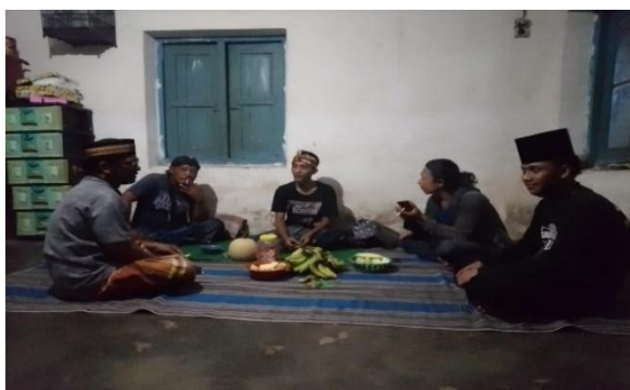
Gambar 3. Pendampingan dengan Pengurus Yayasan Baitu Husodo Peduli Indonesia

Perubahan sikap ini disebabkan oleh suasana pendampingan yang inklusif dan berbasis kolaborasi. Selain itu, peningkatan motivasi juga tampak dari hasil wawancara singkat. Sebagian besar pengurus mengaku merasa lebih percaya diri memiliki semangat untuk memperjuangkan anak jalanan