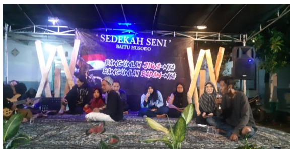
Gambar 1. Peningkatan Pengetahuan pengurus Yayasan Baitu Husodo Peduli Indonesia